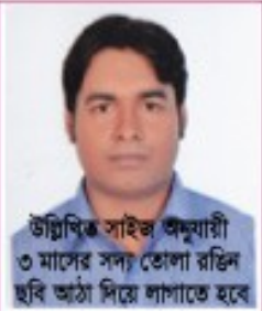
উল্লিখিত সাইজ অনুযায়ী ৩ মাসের সদ্য তোলা রঙিন ছবি আঠা দিয়ে লাগাতে হবে