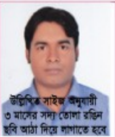
উল্লিখিত সাইজ অনুযায়ী ৩ মাসের সদ্য তোলা রঙিন ছবি আঠা দিয়ে লাগাতে হবে